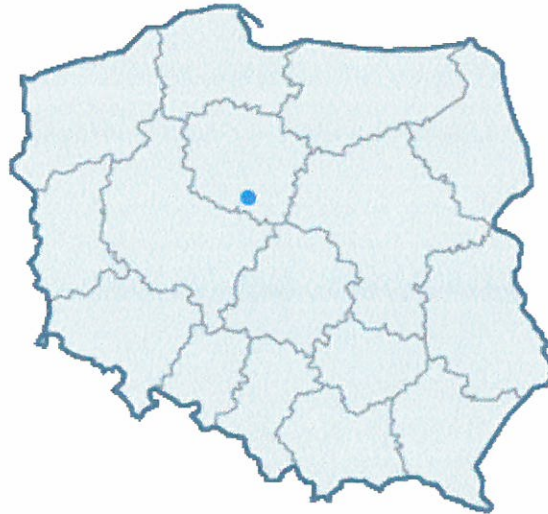
Rys. 1. Lokalizacja miejscowości Jaranowo Duże na terenie Polski