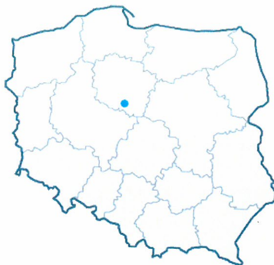
Rys. 1. Lokalizacja miejscowości Toporzyszczewo Stare na terenie Polski